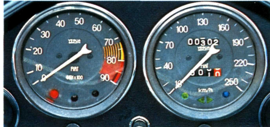
Contagiri e tachimetro.