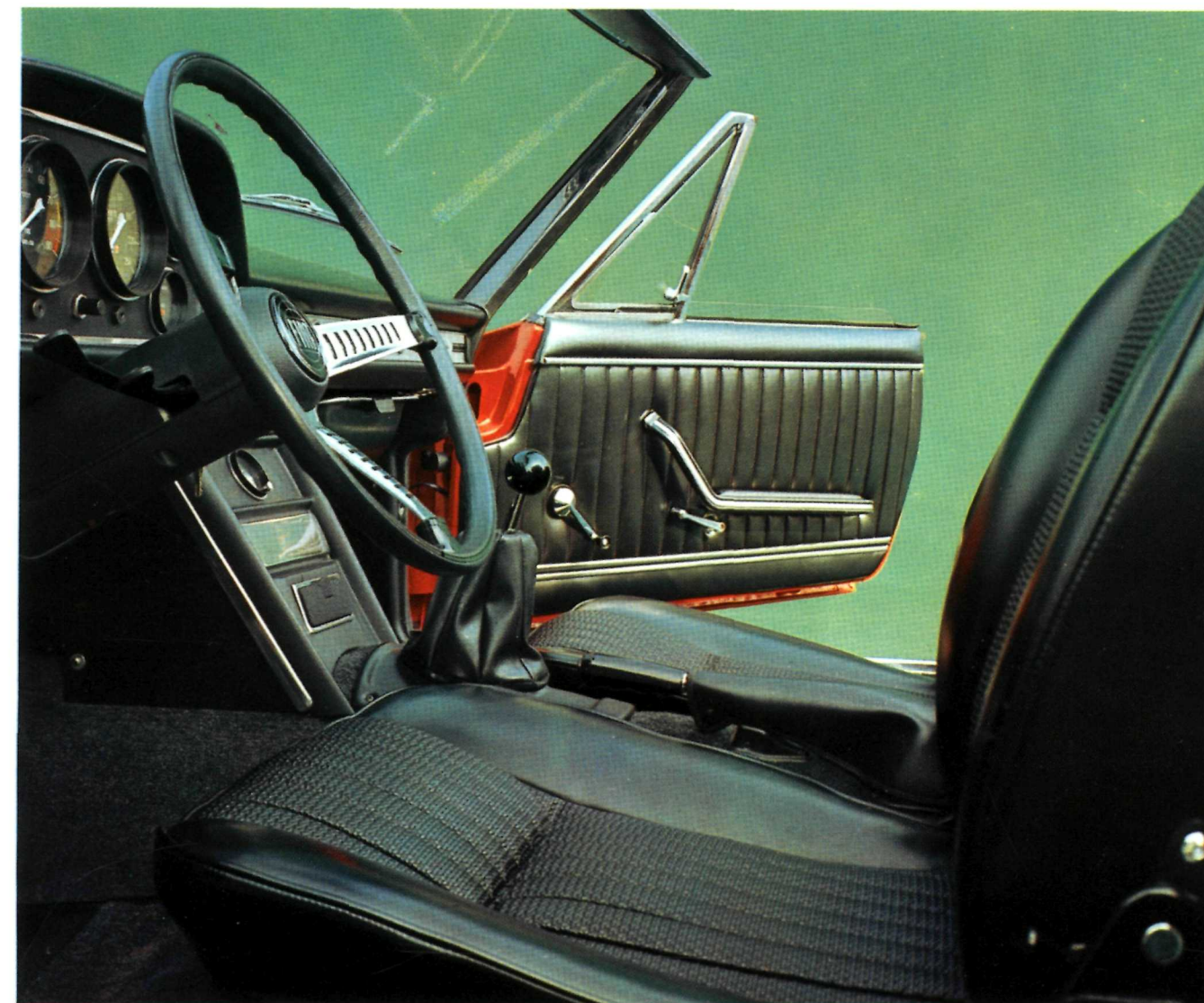
Assetto di guida per la miglior condotta sportiva della vettura.